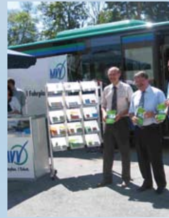
Eine Erfolgsgeschichte – 25 Jahre MWV-Busse im Landkreis