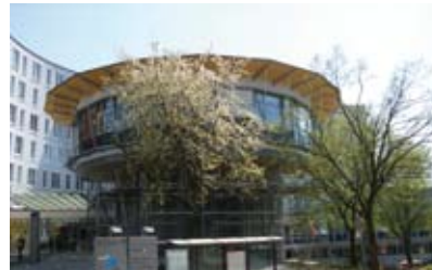
Mehr als nur Grundversorgung – die Amper Kliniken