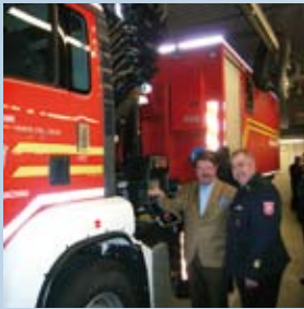
Modernste Einsatzfahrzeuge für die freiwillige Feuerwehr