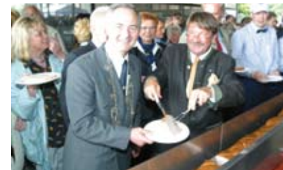
Der ständige Kontakt mit den Menschen im Landkreis gibt wichtige Impulse