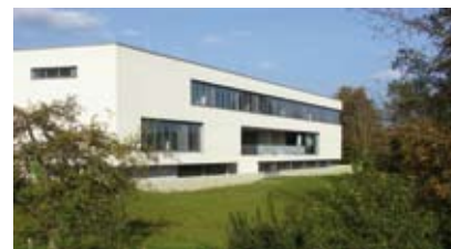
Der Neubau an der Realschule Weichs – ein weiteres Juwel in der Schullandschaft