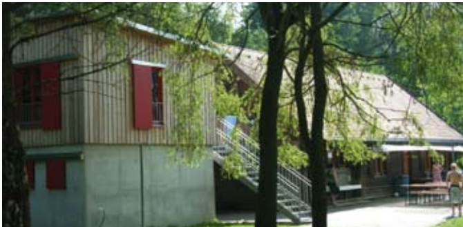
Seit Jahren beliebt – die Kreisjugendeinrichtung in Ainhofen