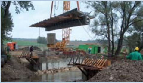
Aufwändig aber notwendig – Brückenbau über die Glonn bei Taxa