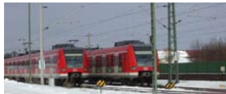
Solche S-Bahnzüge sollen bald auch nach Altomünster fahren