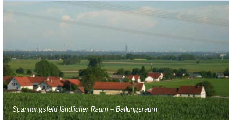
Spannungsfeld ländlicher Raum – Ballungsraum