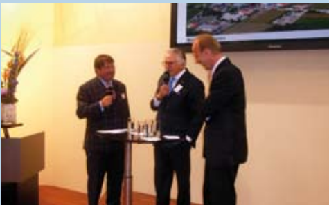
Standortwerbung für den Landkreis auf der Münchner Messe