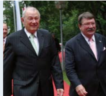
Gute Kontakte helfen dem Landkreis – Landrat Christmann hat sie

Blieben Sie mit Landrat Hansjörg Christmann auf der Erfolgsspur für eine bestmögliche Zukunft des Dachauer Landkreises. Ihre breite Zustimmung und Unterstützung ist dafür notwendig.