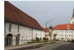
Ein Denkmalensemble – die Realschule Indersdorf soll erweitert werden