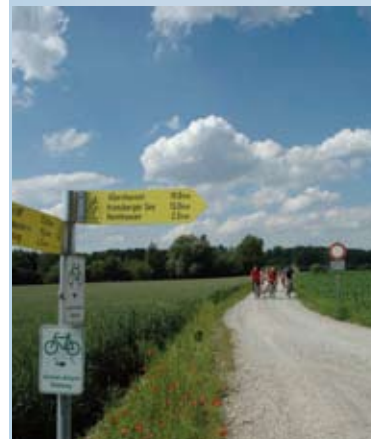
Ammer-Amper-Radweg durch den Landkreis