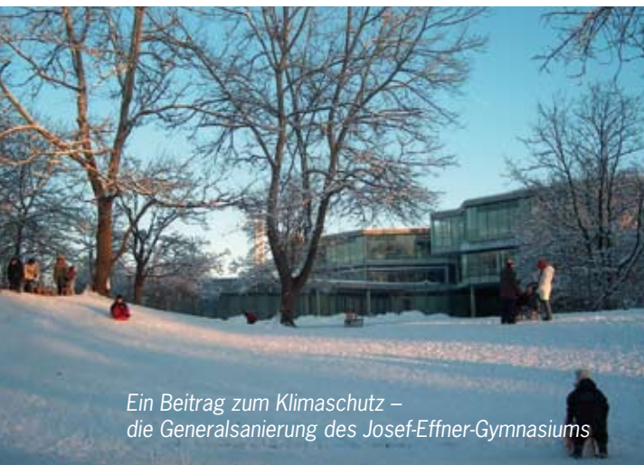
Ein Beitrag zum Klimaschutz – die Generalsanierung des Josef-Effner-Gymnasiums