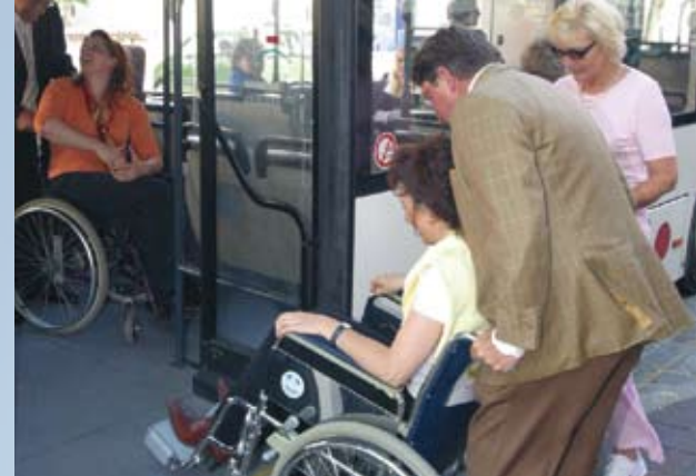
Dem Alltag von behinderten Menschen auf der Spur