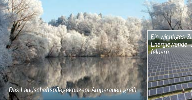
Das Landschaftspflegekonzept Amperauen greift

Ein wichtiges Zukunftsthema – Energiewende z.B. mit Solar- feldern