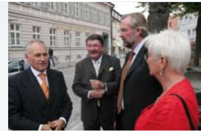
Bayerns Finanzminister Erwin Huber und Bundestagsvizepräsidentin Gerda Hasselfeldt zu Besuch in Dachau